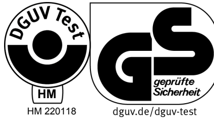
Bei einer Höhe von 20 mm oder weniger ebenfalls zulässige Ausführung