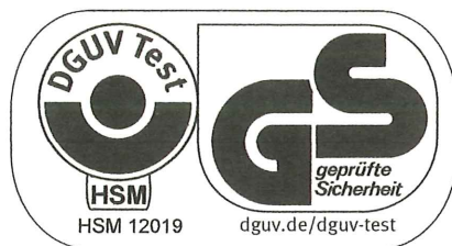
Bei einer Höhe von 20 mm oder weniger ebenfalls zulässige Ausführung